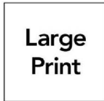
Bản in cỡ to