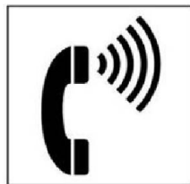
Điện thoại có điều chỉnh âm lượng nghe