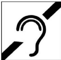
Người khiếm thính