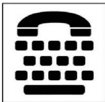
Điện thoại có bàn phím chữ