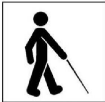
Người khiếm thị