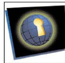
Tiếp cận Web